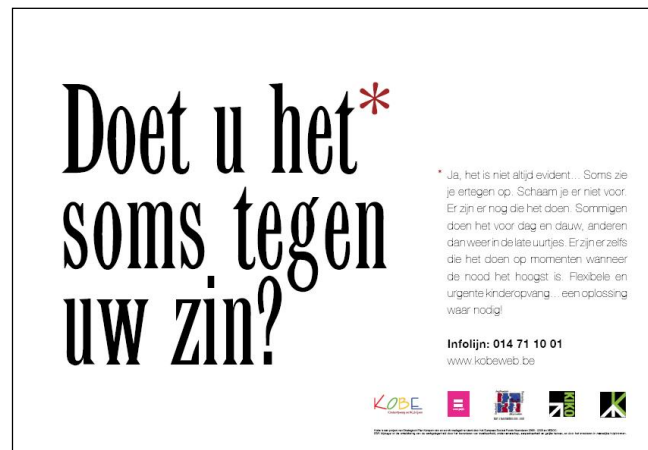
Figuur 4 affiche "Doet u het* soms tegen uw zin?"

Het gebruik maken van kinderopvang tijdens flexibele opvanguren of voor het instappen in een opleiding, wordt door de maatschappij vaak bestempeld als slecht ouderschap. Deze maatschappelijk kritiek heeft soms invloed op de keuze van ouders om een baan, ploegenarbeid of een opleiding aan te vatten of verder te zetten. De negatieve sfeer errond creëert een maatschappelijke druk die, in combinatie met de mogelijkheden op de Kempense arbeidsmarkt, mee een oorzaak is van de hoge vrouwelijke werkloosheidsgraad in de regio.